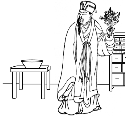
Figure 21.1. La médecine énergétique chinoise s'est développée en quatre pratiques cliniques : l'acupuncture, la phytothérapie, la massothérapie et la thérapie du Qi Gong médical.

Si la plupart des maladies présentent des symptômes ou des manifestations s'exprimant dans plusieurs aspects de la vie du patient (physique, mental, émotionnel, énergétique et spirituel), la cause initiale de la maladie prend le plus souvent racine dans une zone spécifique. Par exemple, un traumatisme lié à un impact peut être enraciné dans le corps physique tout en affectant d'autres aspects de la vie du patient à cause des blocages énergétiques que crée ce bouleversement émotionnel. De même, une perturbation émotionnelle peut parfois être à l'origine de symptômes physiques et entraîner une dysharmonie énergétique et spirituelle.