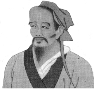
Figure 56.5. Hua Tuo (110-207).