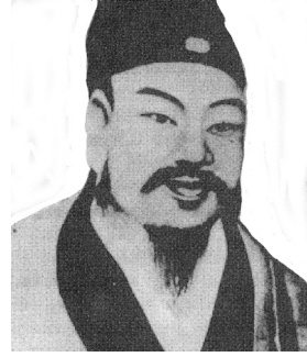
Figure 56.4. Zhang Zhongjing (150-210).

Au cours de la dynastie Jin, le célèbre alchimiste taoïste Ge Hong (Figure 56.7) souligne dans son ouvrage Zhou Hou Bei Ji Fang ( Prescriptions d'urgence ) que l'apparition et le développement d'une tumeur sont généralement précédés par l'aggravation de certains symptômes. Ge Hong conseillait vivement aux personnes de consulter leur médecin pour qu'il diagnostique et traite ces symptômes dès leur apparition, le rôle du médecin étant d'éviter le développement ou la propagation de la tumeur.