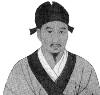
Figure 56.6. Huang Fu Mi (215-286).