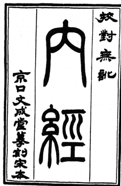
Figure 56.2. Page de garde du Huangdi Neijing .

Au cours de la dynastie Qin et Han, deux éminents médecins occupèrent