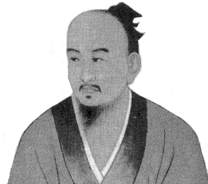
Figure 56.7. Ge Hong (281-341).